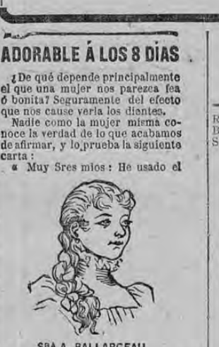
SPA A. BALLARGEAU

ADORABLE A LOS 8 DIAS De qué depende parecerse el que una mujer nos parezca fea ó bonita? Seguramente del efecto que nos cause verla los dientes.